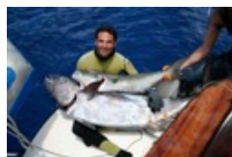
STAGES DE CHASSE SOUS MARINE